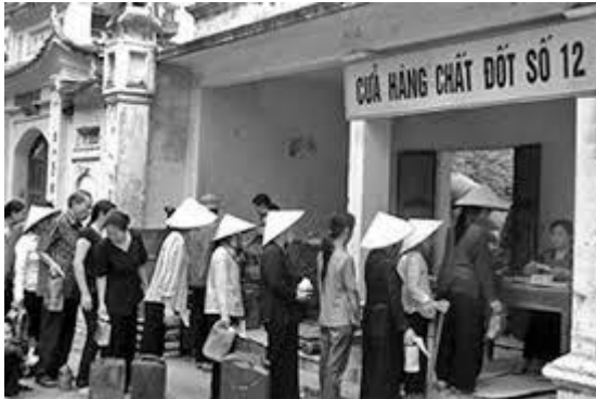
Xếp hàng ở các cửa hàng mậu dịch