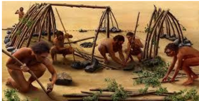
Chế độ cộng sản nguyên thủy