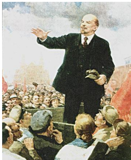
Hình thái KTXH cộng sản chủ nghĩa