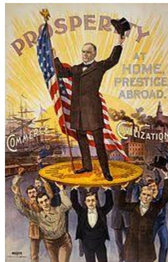
Hình thái KTXH tư bản chủ nghĩa